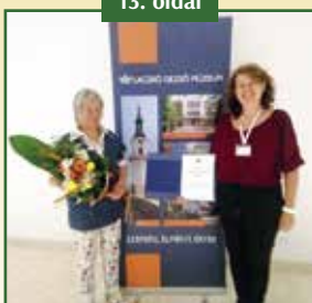
RANGOS ELISMERÉS A POMÁZI ÖRÖKSÉG TÁJHÁZNAK