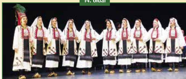
40 ÉVES AZ OPANKE