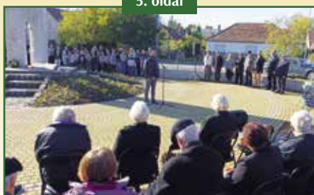
VÁROSI MEGEMLÉKÉZÉS AZ 1956-OS FORRADALOM HŐSEIRŐL