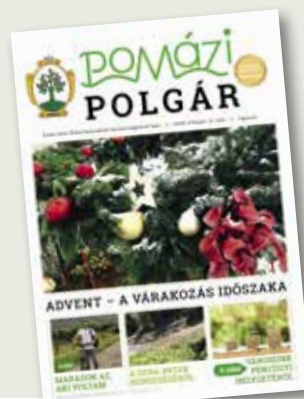
Az első és az 50. lapszám