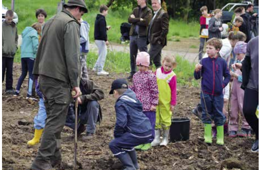
► Helyi iskolások, óvodások is segítettek a faültetésben tavaly tavasszal

A kocsányostölgy, vadalma és más elegy fajok csemeték az idei évben 50-60 cm magassági növekedést produkáltak. Az ültetési időszak még tavaszig kitart, így addig kerülnek még az erdőrésztlet soraiba elegyfajok. Az első év a legkritikusabb egy új erdő