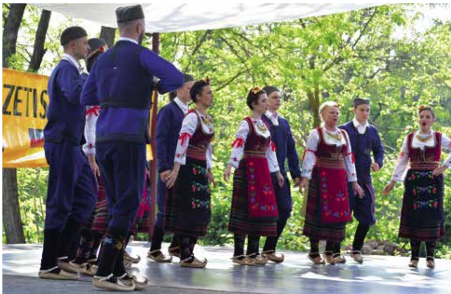
► Opanke fellépése a 30. Dunakanyar Nemzetiségi Fesztiválon

Opanke Szerb Hagyományörző Kulturális Egyesület elnöke