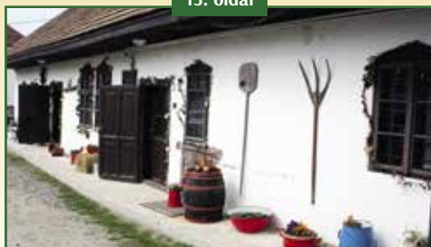
40 ÉVE ALAKULT A POMÁZI TÁJHÁZ