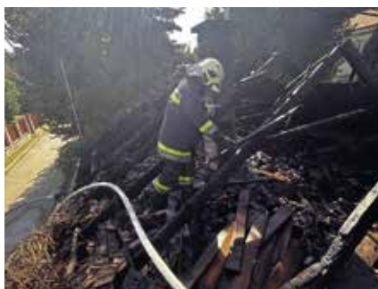
Melléképület tetőszerkezete lángolt

75 négyzetméter alapterületű melléképület tetőszerkezete égett teljes terjedelmében szeptember 3-án Pomázon a Rózsa utcában. A helyszínre két gépjárművel érkeztek a pomázi önkéntes tűzoltók. A munkálatokat nehezítette a hőség és a messze található tűzcsap. A tüzet négy vízsugárral eloltották. Egy személyt a mentők megvizsgáltak, aki nem sérült meg, ezért nem szállították kórházba.