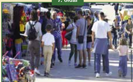
SOK VIDÁM, SZÍNES PROGRAM POMÁZ VÁROS NAPJÁN