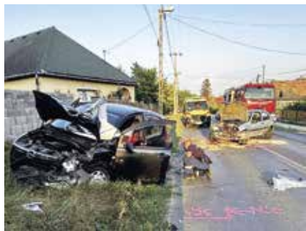
Két személyautó ütközött össze a margitligeti úton

Budakalászi örsünk folyamatosan részt vett a dunai árvízi védekezés figyelő szolgálatában.