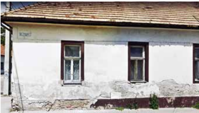
► A felújítás előtti és utáni állapot

A Beniczky utca 8. szám alatti, helyi egyedi védelemmel rendelkező egykori „Mocsáry-villa” homlokzatfelújítása