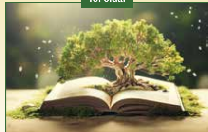
ZÖLDKÖNYVEK A KÖNYVTÁRBÓL