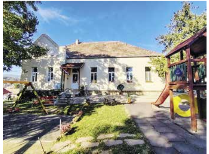
► Mesedombi Tagóvoda

Mesedombi Tagóvoda Mesevár Tagóvoda Hétszínvirág Óvoda Napsugár Tagóvoda