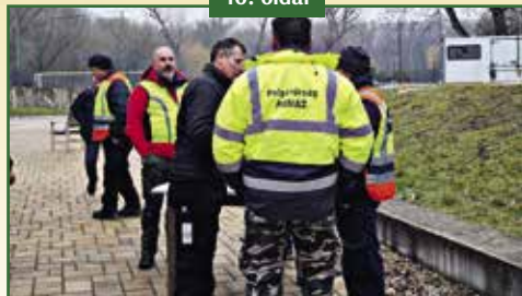
POMÁZI SEGÍTSÉG ELTÚNT SZEMÉLY KERESÉSÉBEN